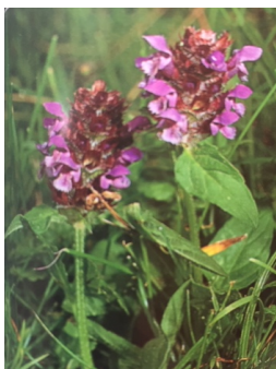
Die Kleine Braunelle